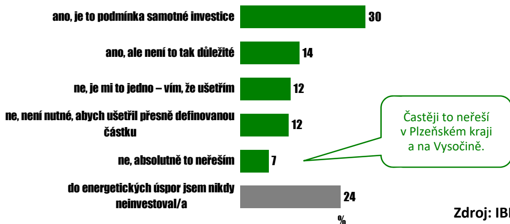
Graf 2: Do energetických úspor investovaly tři čtvrtiny lidí

Lidé si většinou stavební spoření spojují s rekonstrukcemi, jako jsou výměna oken, oprava fasády či nová střecha. Stavební spoření však financuje také investice do energetických úspor od pořízení solárních panelů přes zateplení fasády až po instalaci tepelného čerpadla.